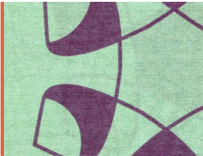
reseda, pflaume, Rand paprika