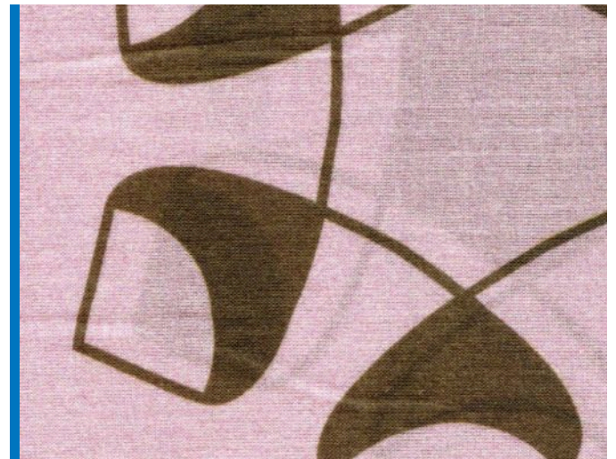
puder, khaki, Rand kobalt