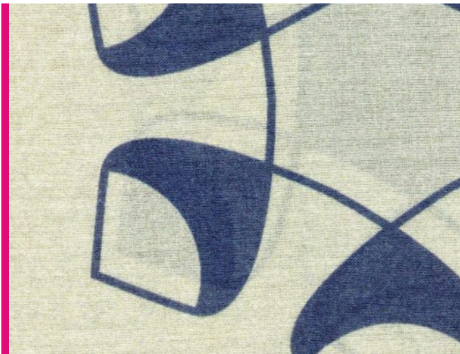
sandstein, taube, Rand hibiskus