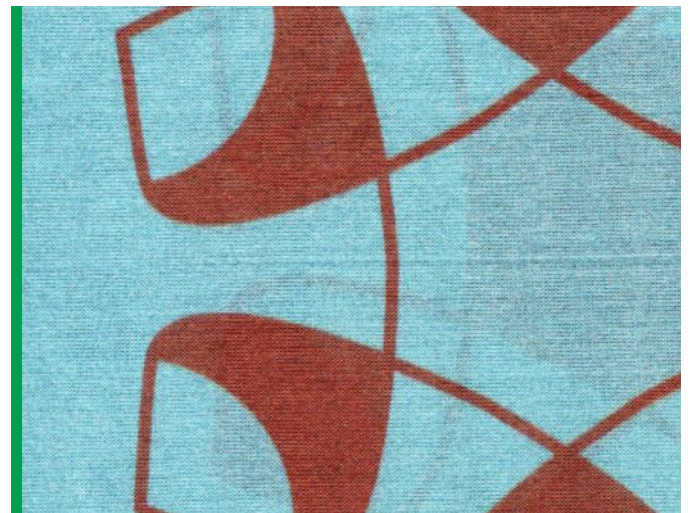
jade, ziegel, Rand wasabi