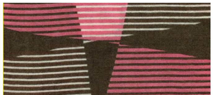
wald, marzipanrot, wollweiss