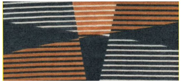
tiefsee, caramel, wollweiss