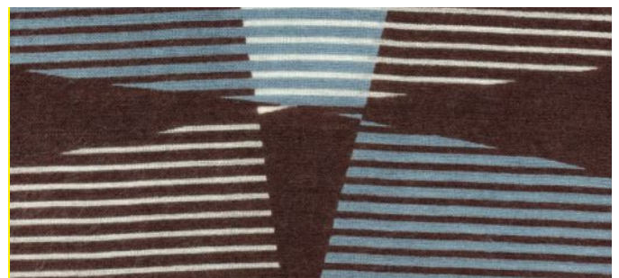
espresso, lagune, wollweiss