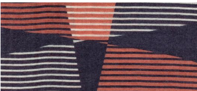
marine, jaspis, wollweiss