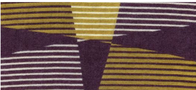
aubergine, flechte, wollweiss