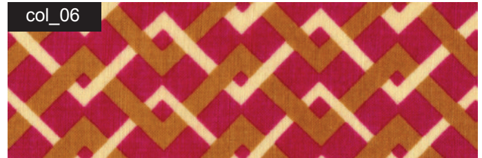
col_06 karmin / senf / sand