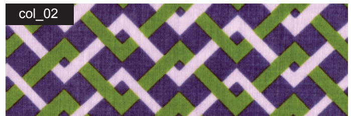
col_02 dunkelviolett / moos / lila