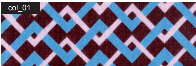
col_01 mahagoni / kornblume / lila