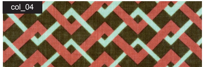
col_04 dunkeloliv / roter achat / mint