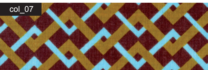
col_07 aubergine / gold / himmelblau