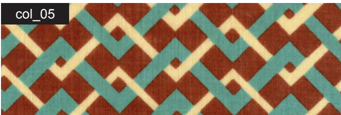
col_05 terracotta / türkis / sand